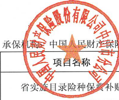
2022年中山市政策性农业保险承保和财政保费补贴情况表